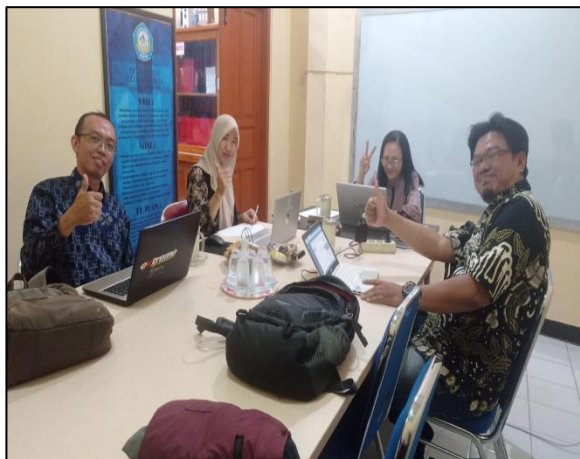
Prodi Diploma Teknik Industri