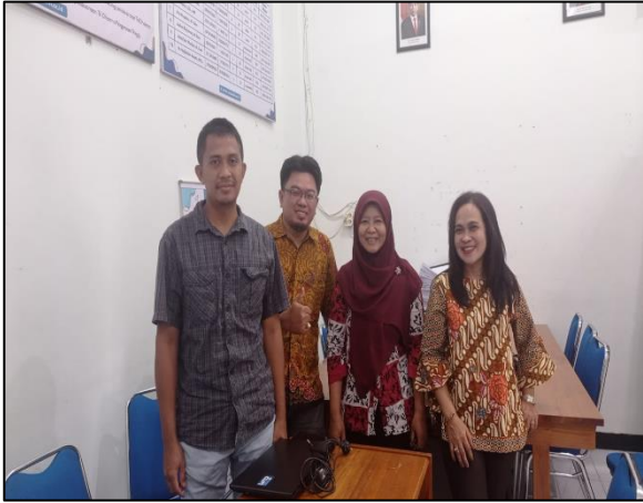
Prodi Sistem Informasi