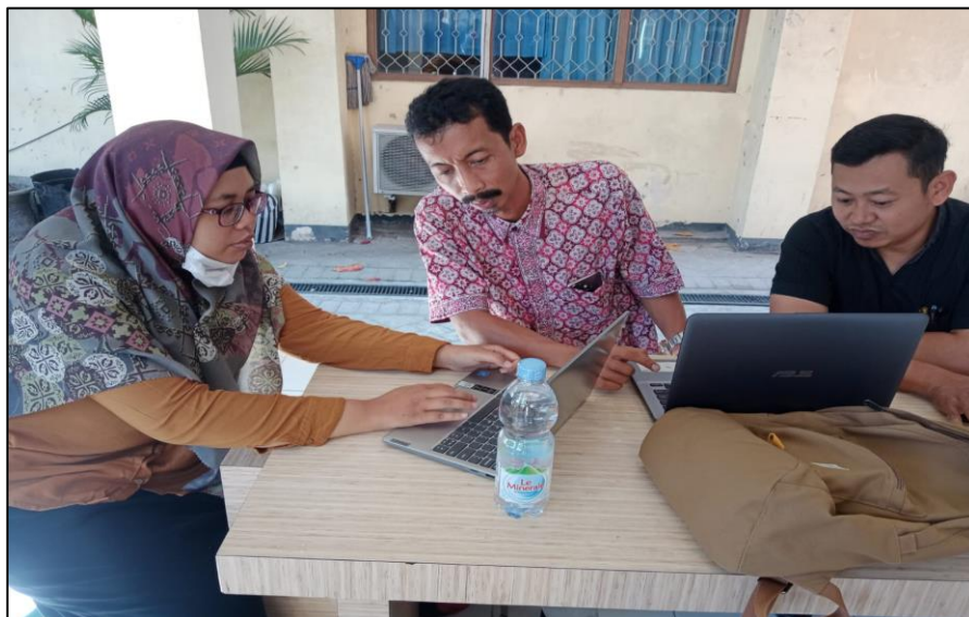
Unit Perpustakaan Publikasi dan Inovasi (PPI)