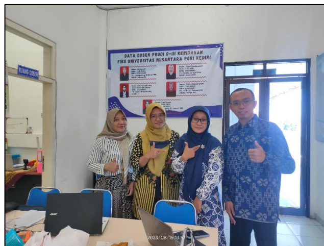
Prodi Diploma Kebidanan