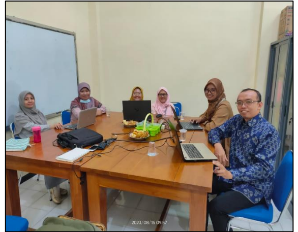
Prodi Diploma Teknik Elektro