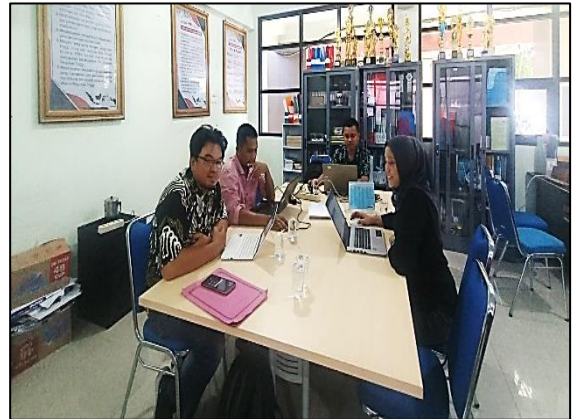
Prodi Pend. Pancasila dan Kewarganegaraan