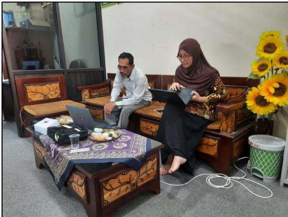
Prodi Pendidikan Bahasa dan Sastra Indonesia