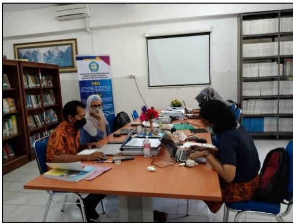
Prodi Pendidikan Ekonomi