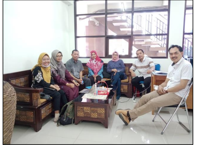
Fakultas Ekonomi dan Bisnis