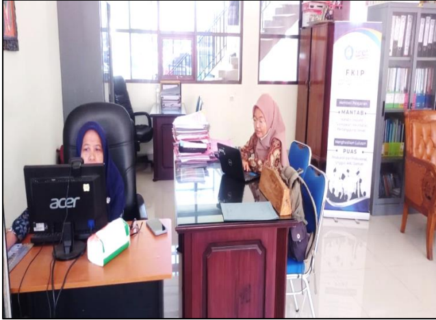
Fakultas Keguruan dan Ilmu Pendidikan