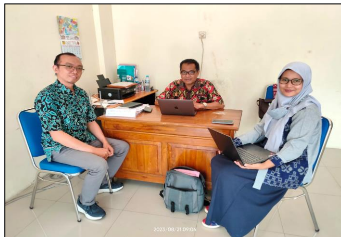
Magister Pendidikan Ekonomi