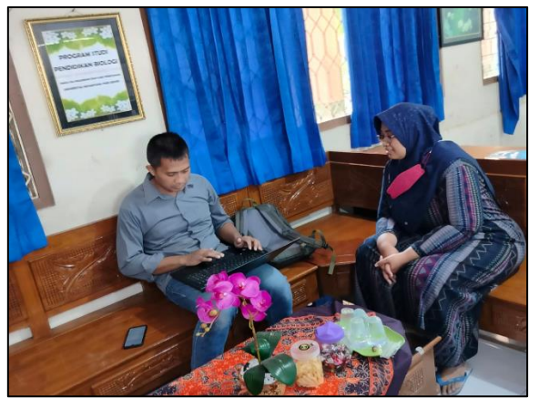
Prodi Pendidikan Biologi