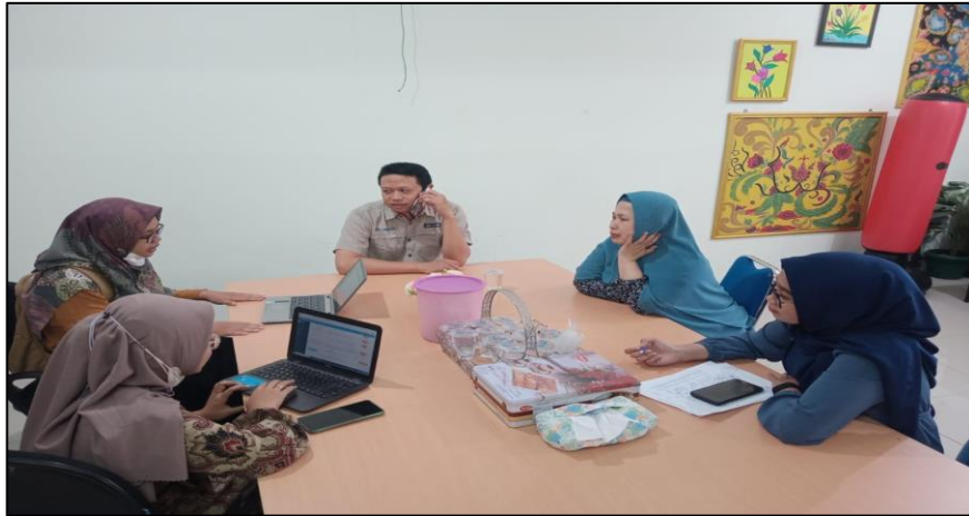
Lembaga Penjaminan Mutu dan Pengembangan Sumber Daya Manusia (LPMPSDM)