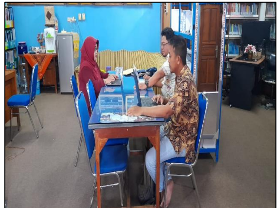
Prodi Pendidikan Bahasa Inggris