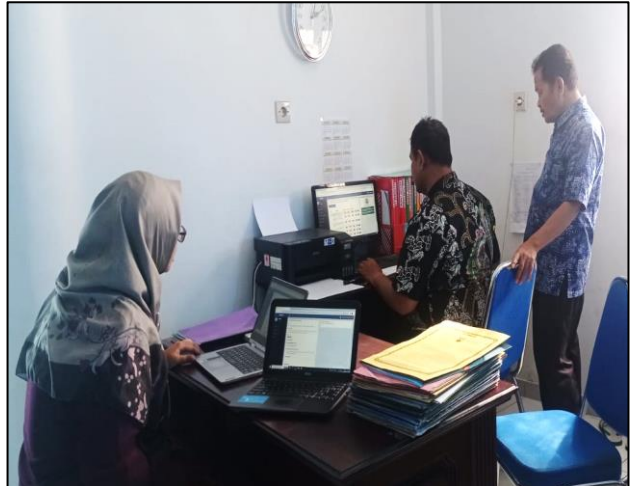
Fakultas Ilmu Kesehatan dan Sains