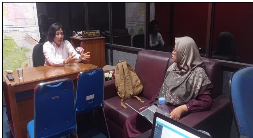
Lembaga Pengembangan Kompetensi Mahasiswa (LPKM)