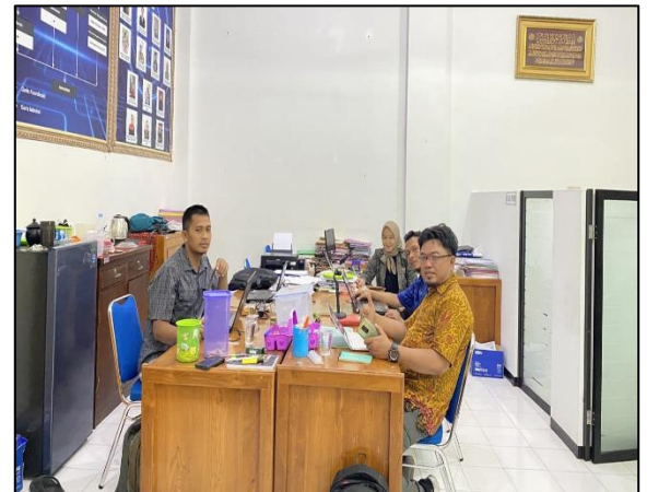
Prodi Teknik Mesin