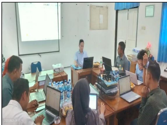
Prodi Pendidikan Guru Sekolah Dasar