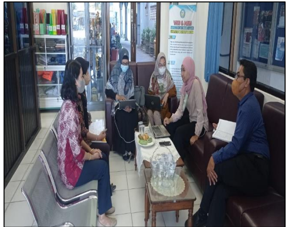
Prodi Diploma Keperawatan