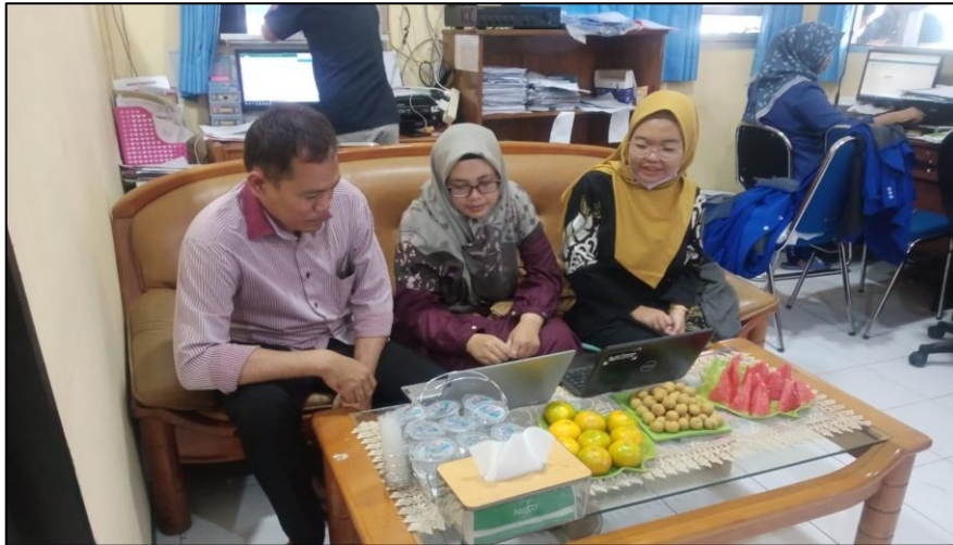
Biro Administrasi Umum (BAU)