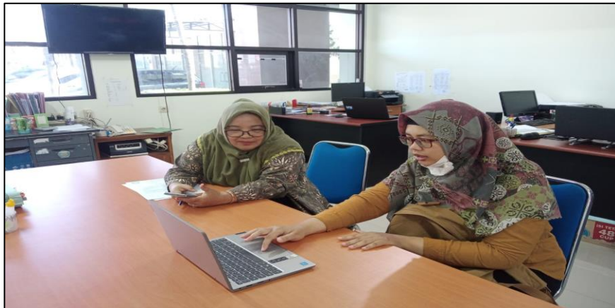
Lembaga Penelitian dan Pengabdian kepada Masyarakat (LPPM)