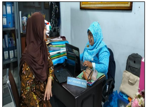
Prodi Pendidikan Guru Pendidikan Anak Usia Dini