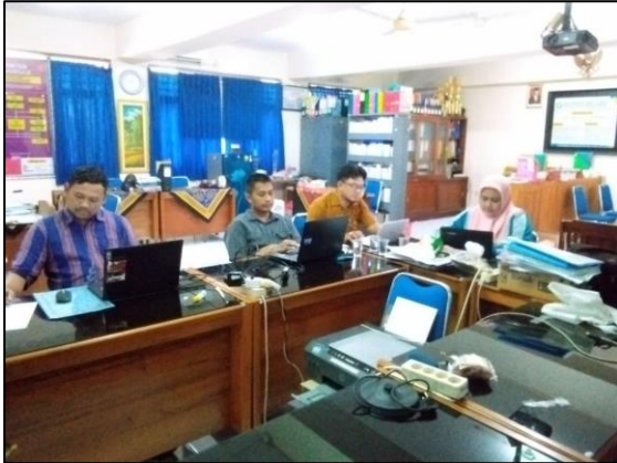
Prodi Bimbingan dan Konseling